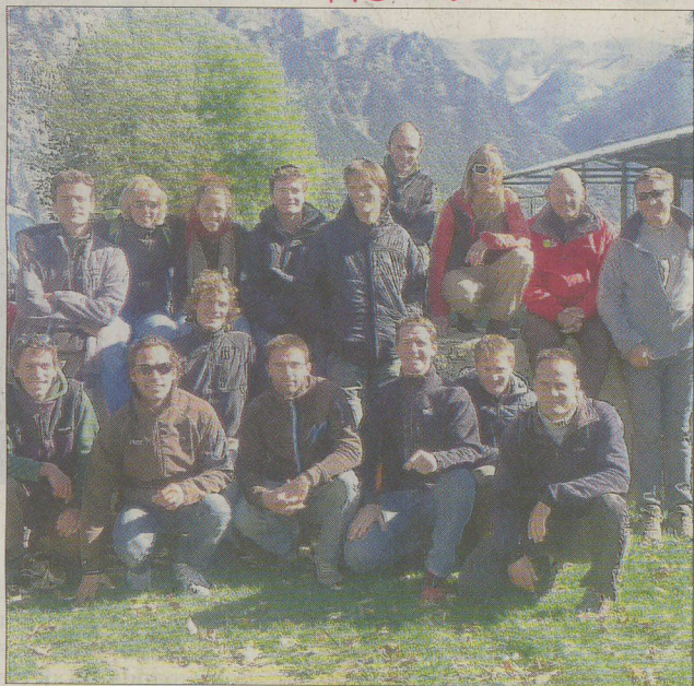
Le groupe de futurs moniteurs parmi lesquels trois filles.

Prêt du matériel MV2 05 pour la formation Handi